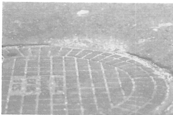
Zdjęcie 2: Zapadająca się studzienka przy posesji nr 27