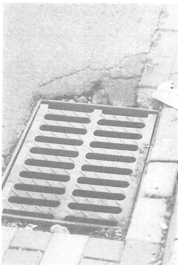
Zdjęcie 3: Studzienka za progiem zwalniającym (przejście dla pieszych)